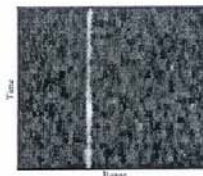
Figura 4b – Periscópio refletido com o sistema de detecção.