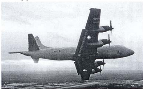
Figura 1 – Aeronave P-3 Orion fabricada pela Lockheed Martin [2]

Visando melhorar à vigilância da imensa região submersa de nosso território, com quase 4,5 milhões de km 2 , equivalente a mais de 50% da extensão territorial do Brasil, foram adquiridas novas plataformas e novos sensores. A aeronave escolhida foi P-3A Orion, fig 1, aeronave consagrada mundialmente pelo excelente desempenho, operando em 16 nações, num total de mais de 420 aeronaves operativas [2].