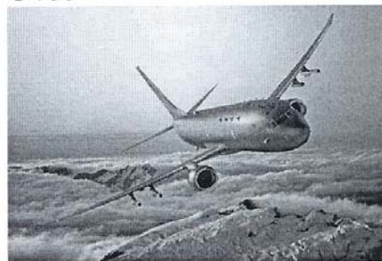
Figura 2 – Aeronave P-8 Multi-Mission Maritime - Boeing [8]

O radar embarcado na aeronave P-3 AM Orion é muito semelhante ao radar AN/APS-137, da Raytheon Company, embarcado em aeronaves HU-130H Hercules da Guarda Costeira dos Estados Unidos da América [7]. Este radar foi escolhido para compor o sistema de sensores da aeronave P-8 Multi-Mission Maritime (MMA), derivado do Boeing 737-800 (Fig 2) [8].