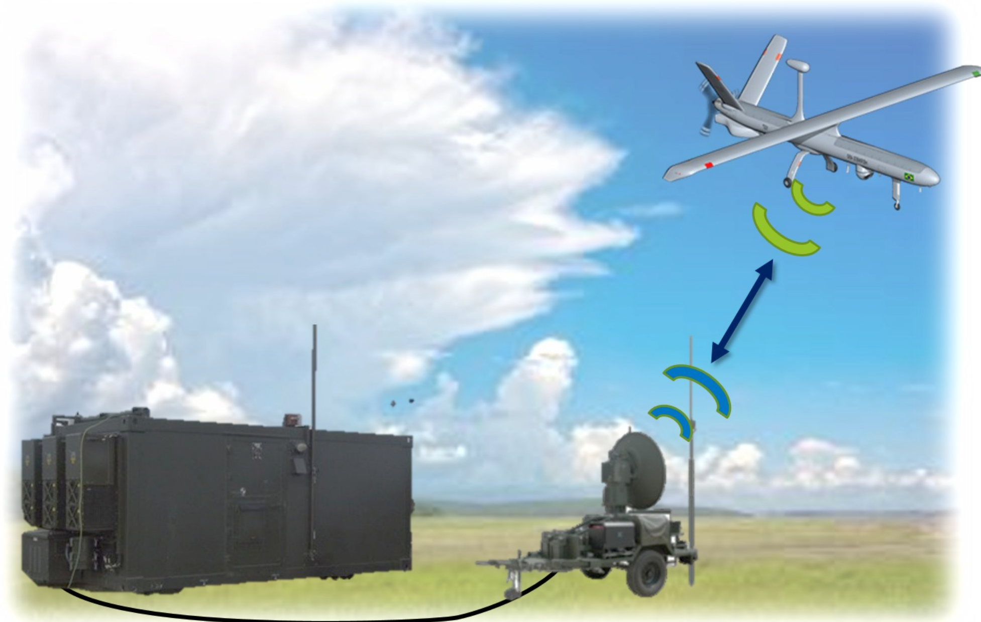
Fig. 1 - Sistema de Aeronave Remotamente Pilotada

A fim de proteger tal enlace, os sistemas podem incluir técnicas de proteção como espalhamento em frequência. No entanto, este trabalho foca apenas nas transmissões em aberto, sem técnicas de proteção.